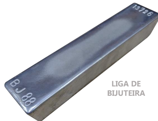
LIGA DE BIJUTEIRA