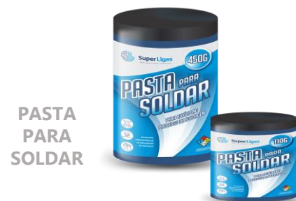
PASTA PARA SOLDAR