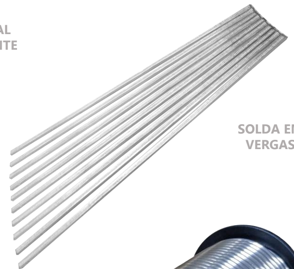
SOLDA EM VERGAS