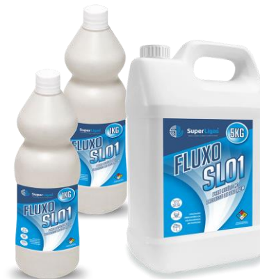
FLUXO PARA SOLDAR