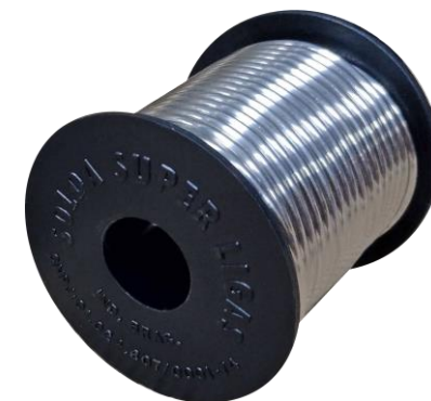
SOLDA EM FIOS